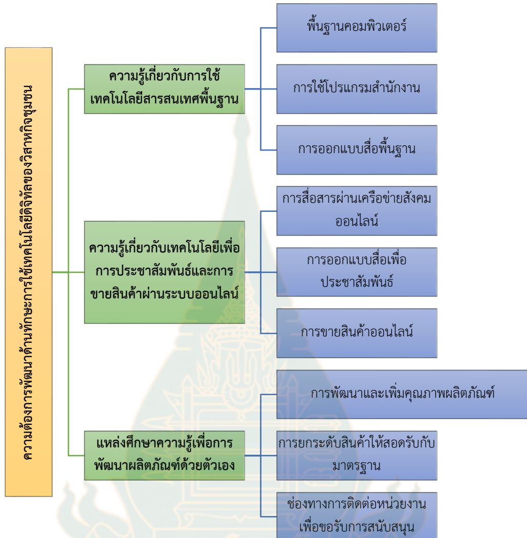
ภาพที่ 2 ร่างข้อสรุปความต้องการพัฒนาด้านทักษะการใช้เทคโนโลยีดิจิทัลของวิสาหกิจชุมชน

จากตารางที่ 3 ผู้วิจัยได้นำข้อมูลที่ได้จากการสัมภาษณ์มาสังเคราะห์เป็นร่างข้อสรุปความต้องการพัฒนาด้านทักษะการใช้เทคโนโลยีดิจิทัลของวิสาหกิจชุมชน โดยมีรายละเอียดดังต่อไปนี้